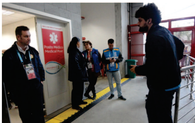
Figura 3. Posto de atendimento médico Estádio Beira Rio.