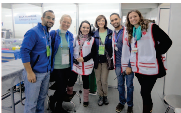
Figura 4. UPA FANFEST.