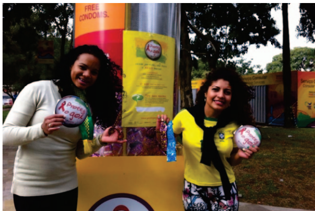
Figura 5. Ações “Proteja o Gol”.

Conforme a ação proposta pelo Departamento de DST/AIDS e Hepatites Virais da SVS/MS, denominada “Proteja o Gol” com foco na prevenção de DST/AIDS, no período de 12/6 a 13/7/14, a Secretaria Municipal de Saúde de Porto Alegre realizou as seguintes ações no trajeto do Caminho do Gol e FIFA FanFest (Figura 5):