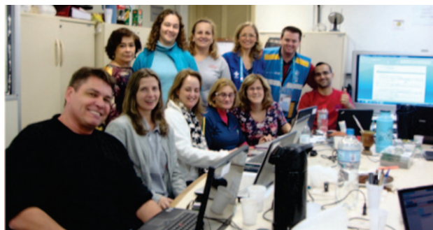
Figura 2. CIOCS/RS em ação.

Para a detecção de possíveis eventos de saúde pública relacionados à Copa 2014, foi realizado o monitoramento diário de rumores em sites como o Healthmap , o Saúde na Copa, Gphin e outros sites de busca e notícias. O recebimento de notificações ocorreu por telefone, e-mails, Disque Vigilância 150 e rádios comunicador, além da coleta de informações diárias nos vários espaços do evento.